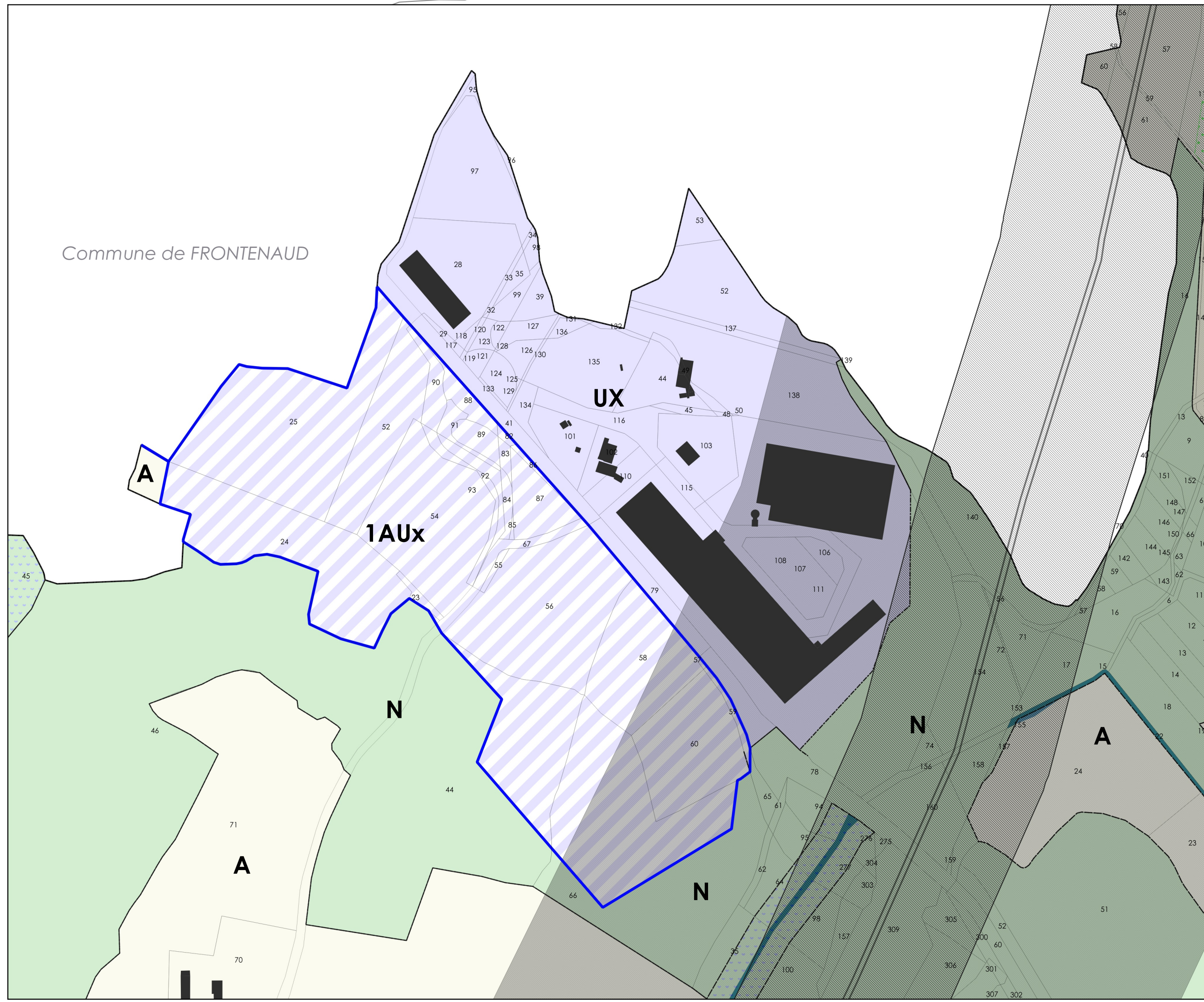
Zoom sur la ZA de Milleure - échelle 1/3500